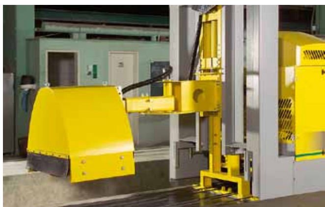
Seitenbürste für die Zwischengänge.

Diese Maschine erledigt all die Arbeiten , die zwischen den einzelnen Betoniervorgängen notwendig sind, sowohl bei einer Extruder- als auch Gleitfertigerproduktion. Diese Maschine ist mit einem 4-Rad-Antrieb ausgerüstet und fährt mit einer Geschwindigkeit von 60 m/min.