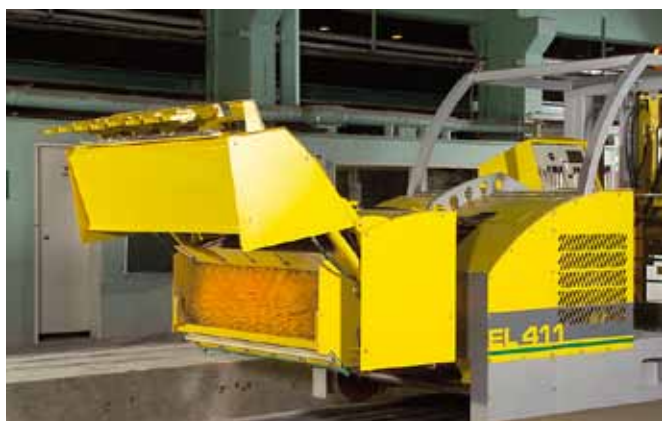
Bürste zum Bahnreinigen.

Verbesserung der Produktqualität durch automatische Vorbereitung der Fertigungsbahnen.